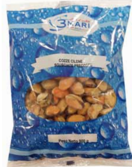
COZZE CILENE SGUSCIATE PRECOTTE peso netto 900 gr