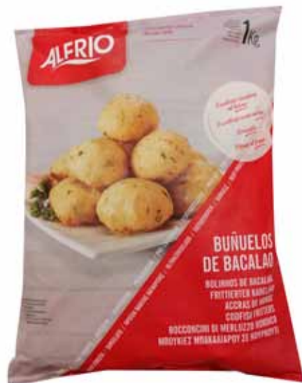
BOCCONCINI DI MERLUZZO NORDICO peso netto 1 kg