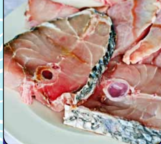
OMBRINA A TRANCI FRESCA