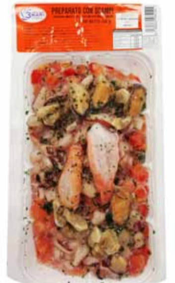
PREPARATO CON SCAMPI peso netto 350 gr