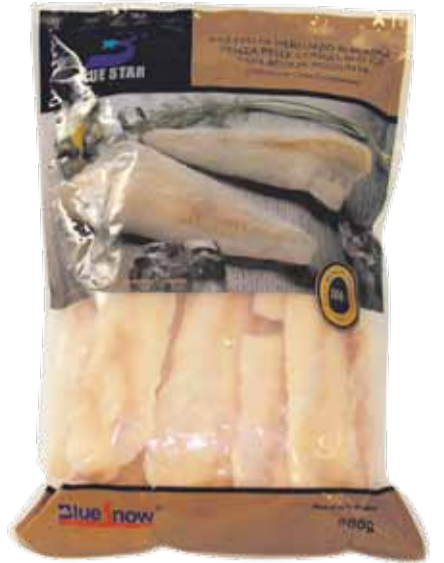
FILETTO DI MERLUZZO D'ALASKA peso netto 800 gr