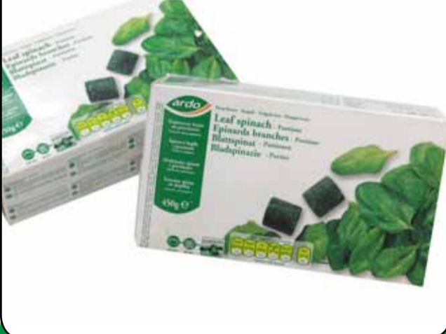
SPINACI FOGLIE peso netto 450 gr