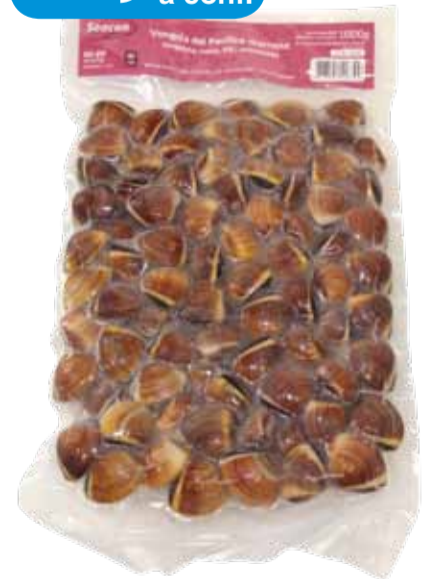
VONGOLE DEL PACIFICO COTTE CON GUSCIO peso netto 1 kg