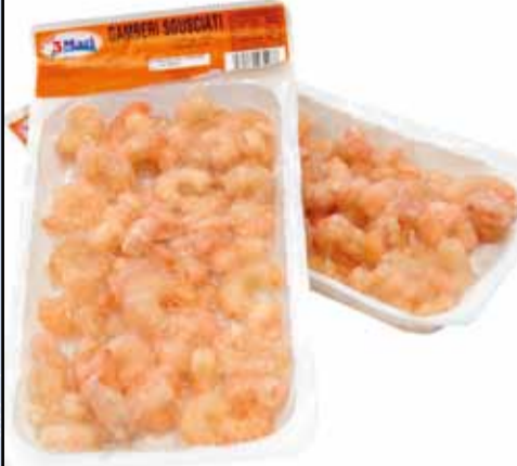
GAMBERI SGUSCIATI SCOTTATI peso netto 200 gr