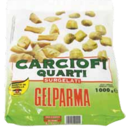
CARCIOFI QUARTI peso netto 1 kg