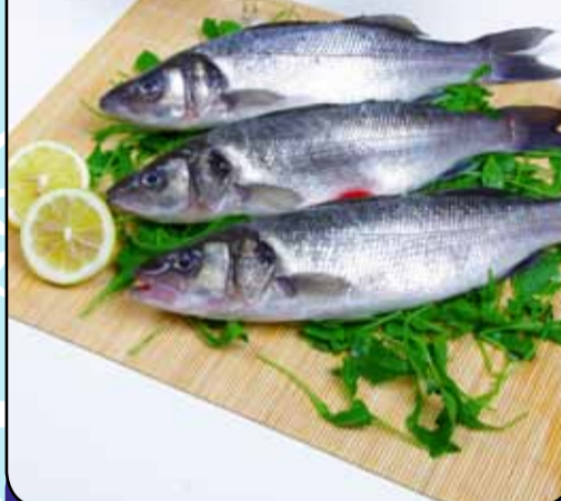
SPIGOLA ALLEVAMENTO pezzatura 200/300 gr