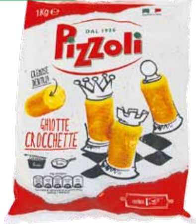
GHOTTE CROCCHETTE peso netto 1 kg