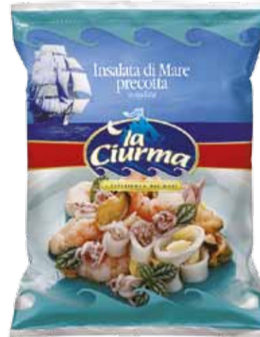
INSALATA DI MARE peso netto 800 gr