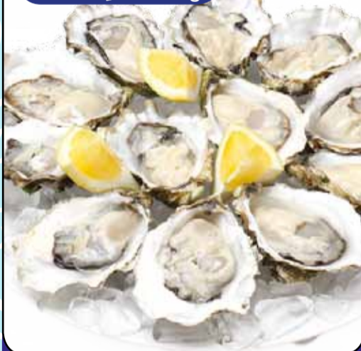
OSTRICHE FRANCESI FRESCHE