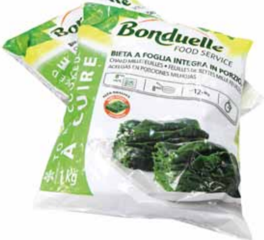
BIETA A FOGLIA INTEGRA IN PORZIONI peso netto 1 kg