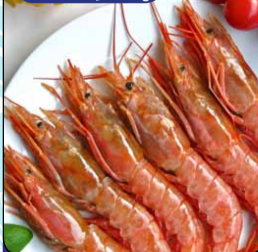
GAMBERI ARGENTINI Decongelati