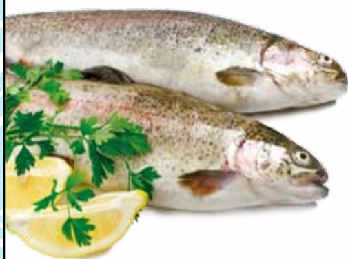
TROTA SALMONATA FRESCA