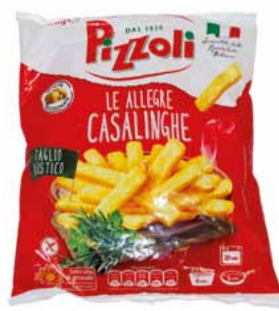
LE ALLEGRE CASALINGHE peso netto 750 gr