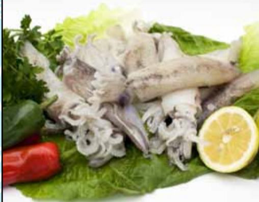
CALAMARI SELEZIONATI Decongelati