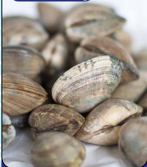
VONGOLE LUPINI FRESCHE