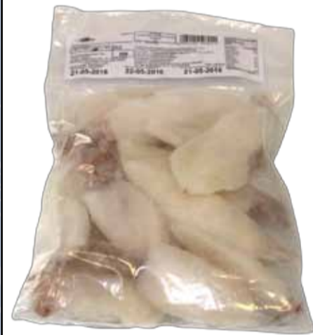
CALAMARO INTERO PULITO pezzatura 10/20 peso netto 800 gr