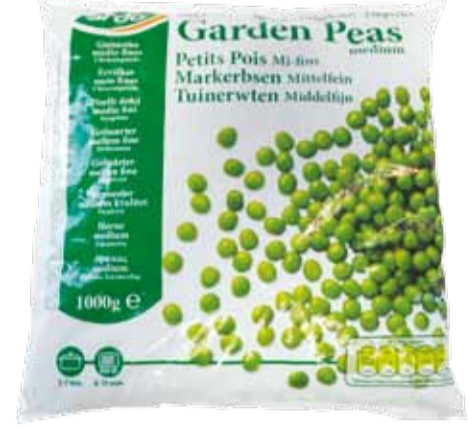
PISELLI DOLCI MEDIO FINI peso netto 1 kg