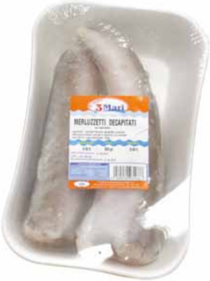
MERLUZZETTI DECAPITATI peso netto 400 gr