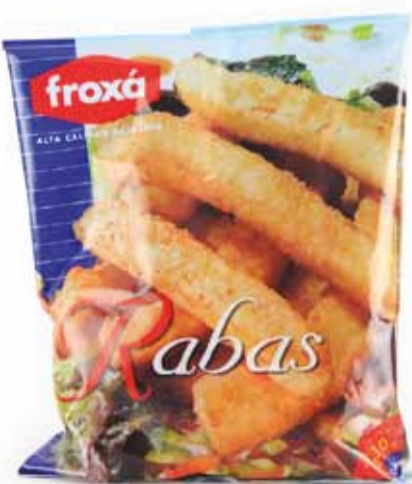
FETTUCINE DI TOTANO PANATE peso netto 400 gr