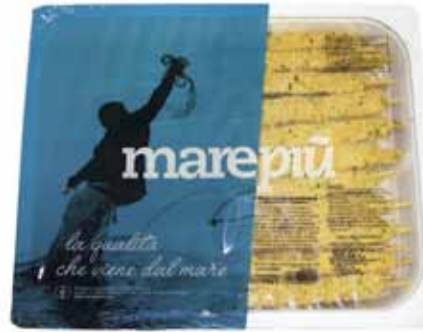
ARROSTICINI DI TOTANO GRATINATI peso netto 1 kg