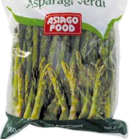
ASPARAGI VERDI peso netto 1 kg