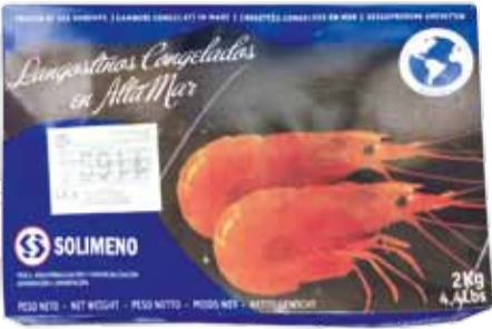
GAMBERI ARGENTINI pezzatura L2 peso netto kg 2