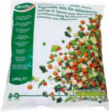
MINISTRONE DI VERDURE peso netto 1 kg