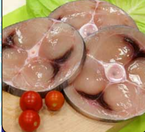
PESCE SPADA TRANCI Decongelato